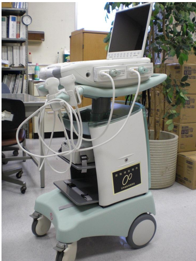
ケ. 飯山赤十字病院 <超音波診断装置(腹部)>