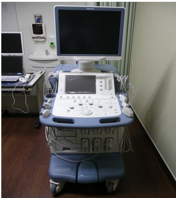
ア. 旭川赤十字病院 <超音波診断装置(腹部)>