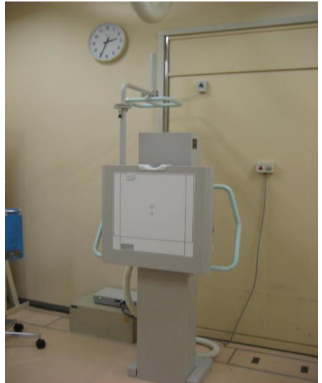
ク. 静岡赤十字病院 <胸部X線撮影装置>