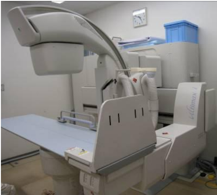
ス. 成田赤十字病院 <X線テレビ装置>