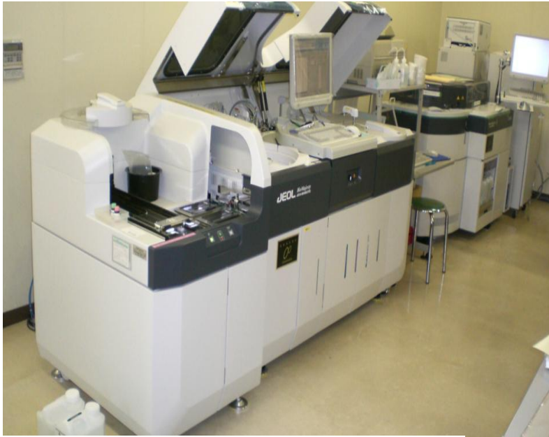
サ. 長浜赤十字病院 <X線テレビ装置>