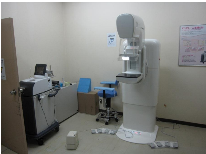
ソ. 福岡赤十字病院 <乳房用 X 線撮影装置>