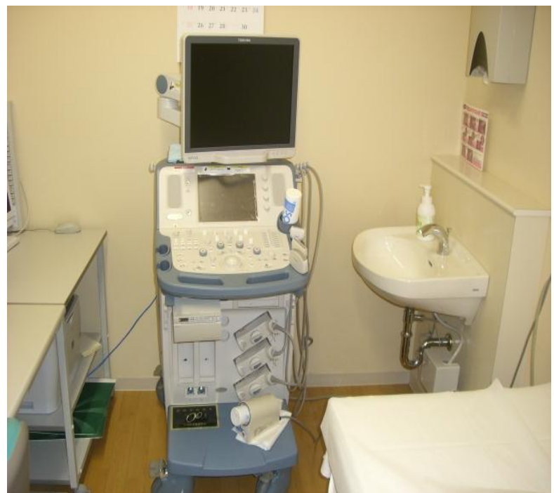
コ. 石巻赤十字病院 <超音波診断装置(腹部)>