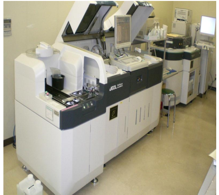
セ. 金沢赤十字病院 <生化学自動分析装置>