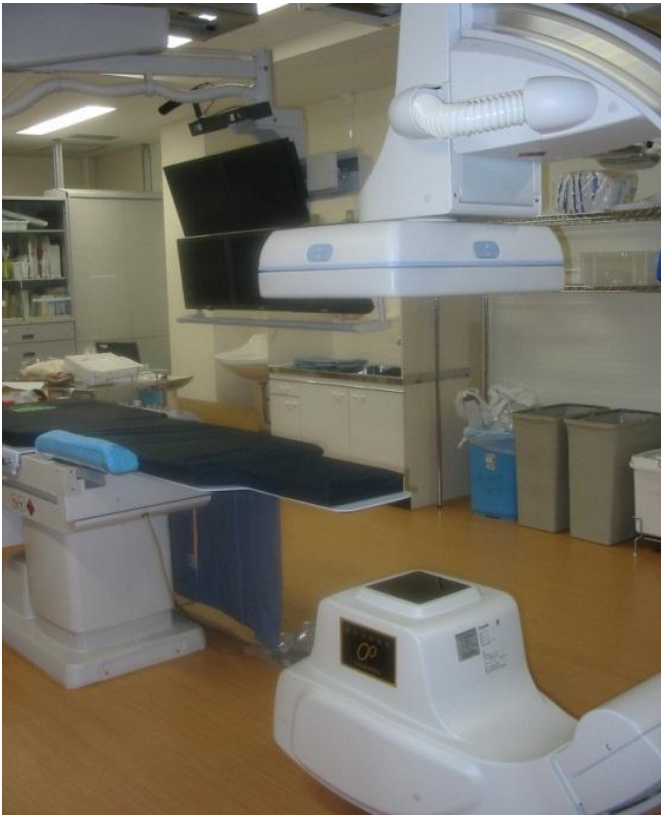
ウ. 高槻赤十字病院 <血管撮影システム>