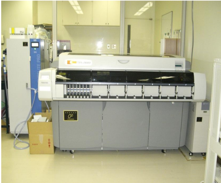
キ. 小清水赤十字病院 <生化学自動分析装置>