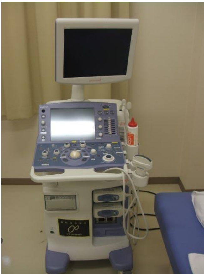
オ. 下伊那赤十字病院 <超音波診断装置(腹部)>