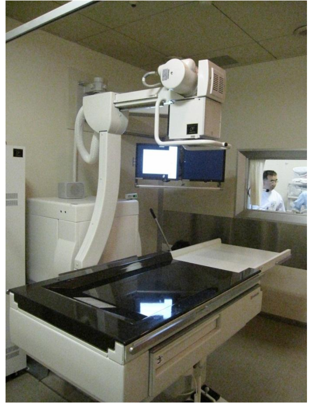
シ. 松山赤十字病院 <X線テレビ装置>