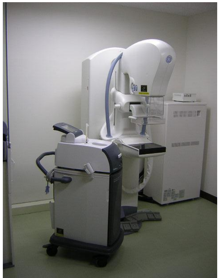
カ. 広島赤十字・原爆病院 <乳房用X線撮影装置>