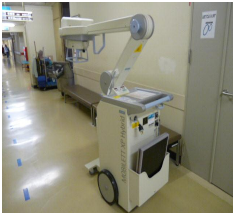
イ. 安曇野赤十字病院 <回診用X線装置>